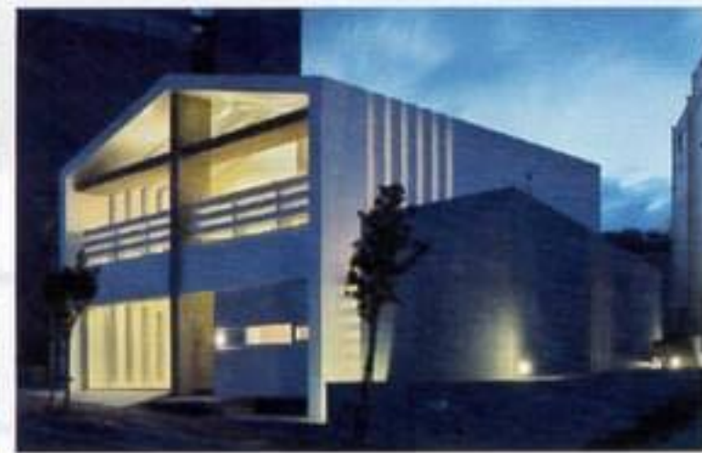
設計:森裕