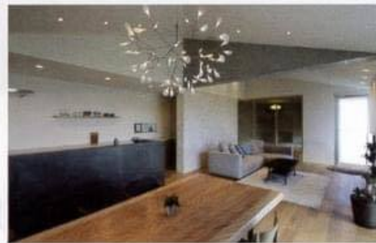
設計:福田哲也