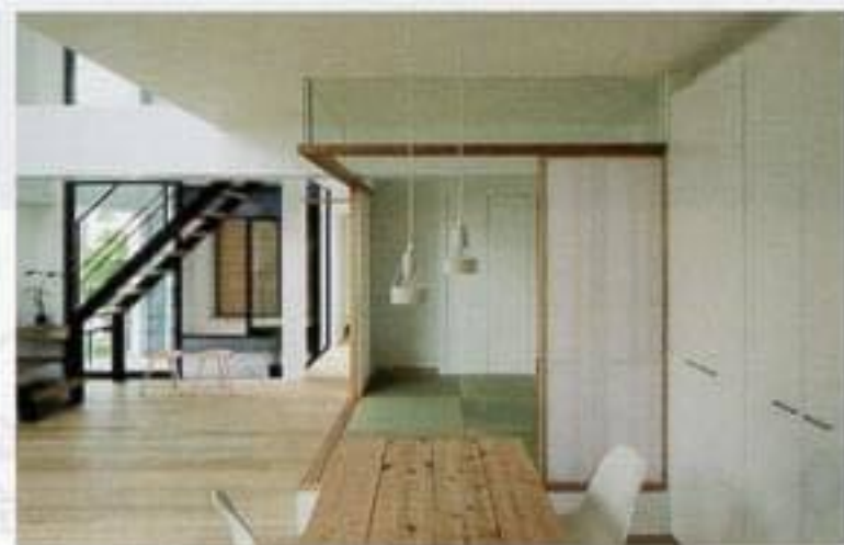
設計:小林進一